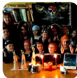
De fyra vinnarna från förra årets tävling med tema Öar i Norden.